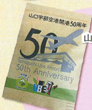
JA山口宇部緑茶センター